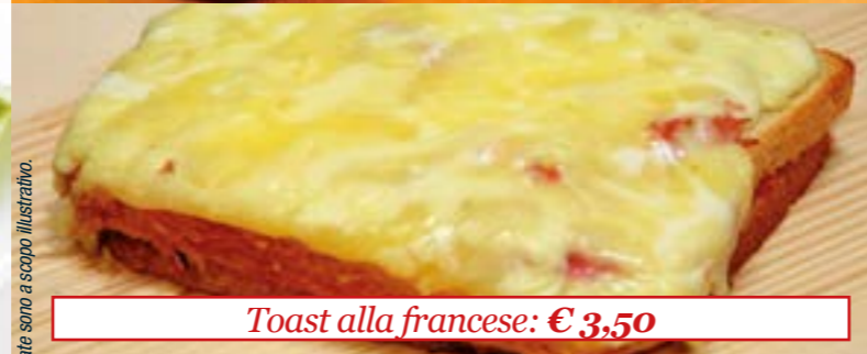
Toast alla francese: € 3,50