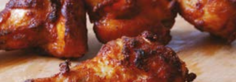
Alette di pollo speziate*: 6 pz. - € 4,00