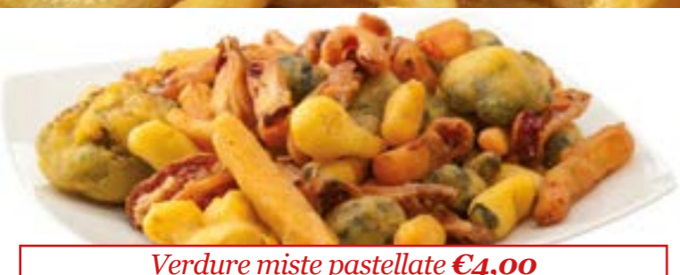
Verdure miste pastellate € 4,00