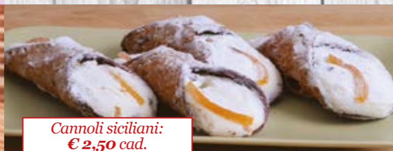
Cannoli siciliani: € 2,50 cad.