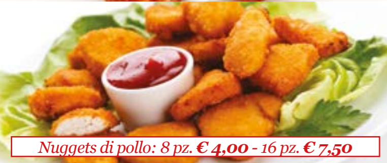
Nuggets di pollo: 8 pz. € 4,00 - 16 pz. € 7,50