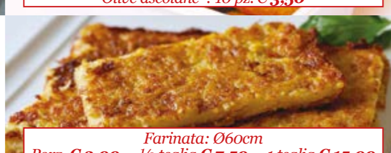
Farinata: Ø60cm Porz. € 2,00 - 1/2 teglia € 7,50 - 1 teglia € 15,00