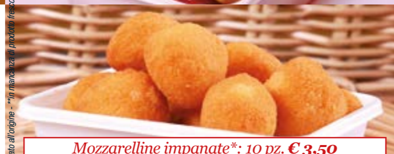
Mozzarelline impanate*: 10 pz. € 3,50