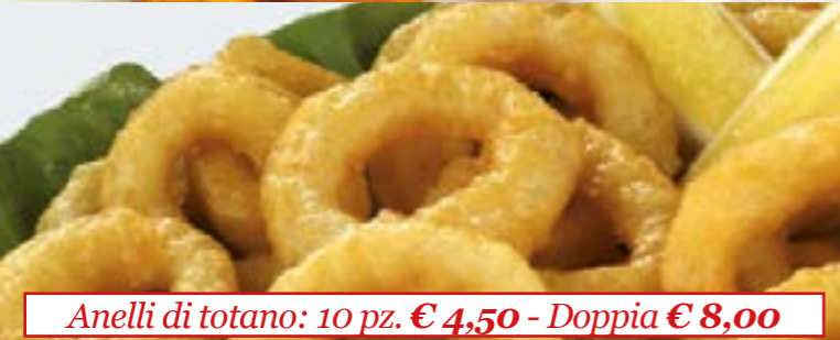
Anelli di totano: 10 pz. € 4,50 - Doppia € 8,00