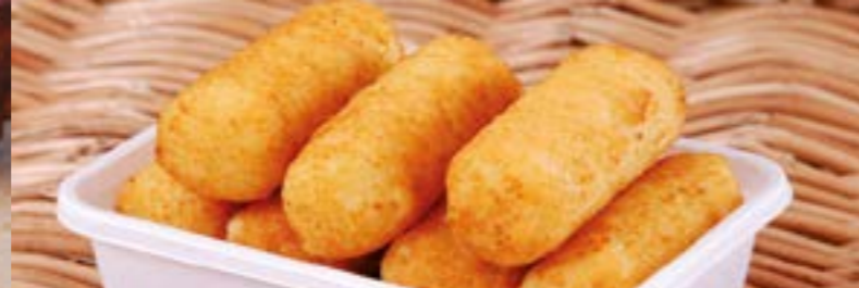
Crocchette di patate*: 8 pz. € 3,50