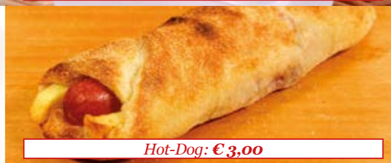
Hot-Dog: € 3,00