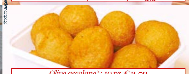
Olive ascolane*: 10 pz. € 3,50