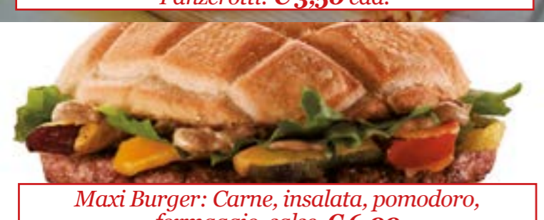
Maxi Burger: Carne, insalata, pomodoro, formaggio, salse. € 6,00