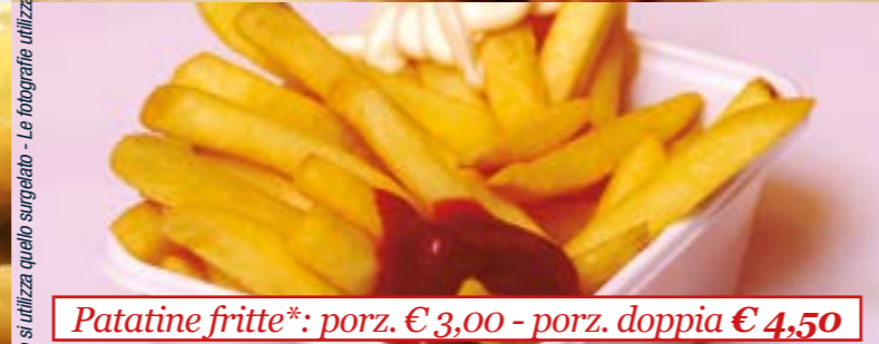
Patatine fritte*: porz. € 3,00 - porz. doppia € 4,50