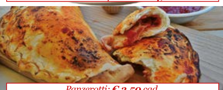
Panzerotti: € 3,50 cad.